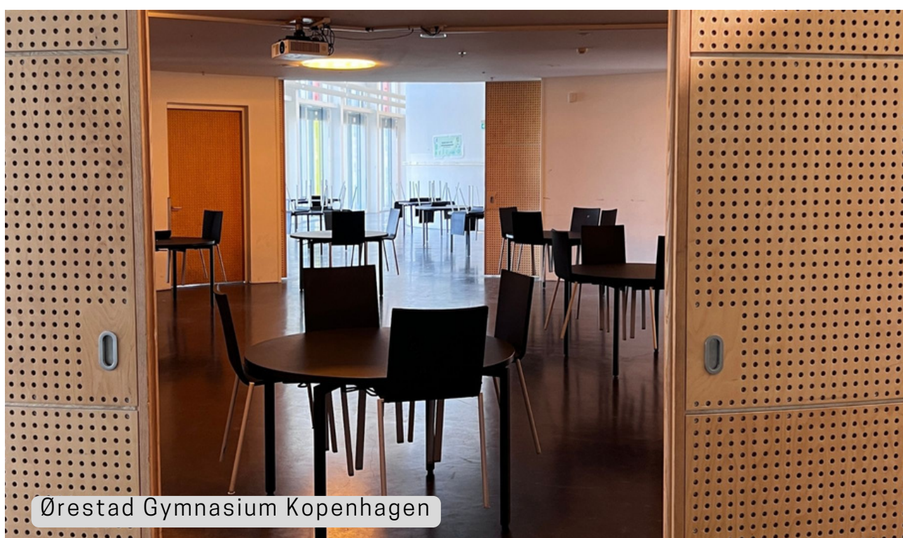
Ørestad Gymnasium Kopenhagen