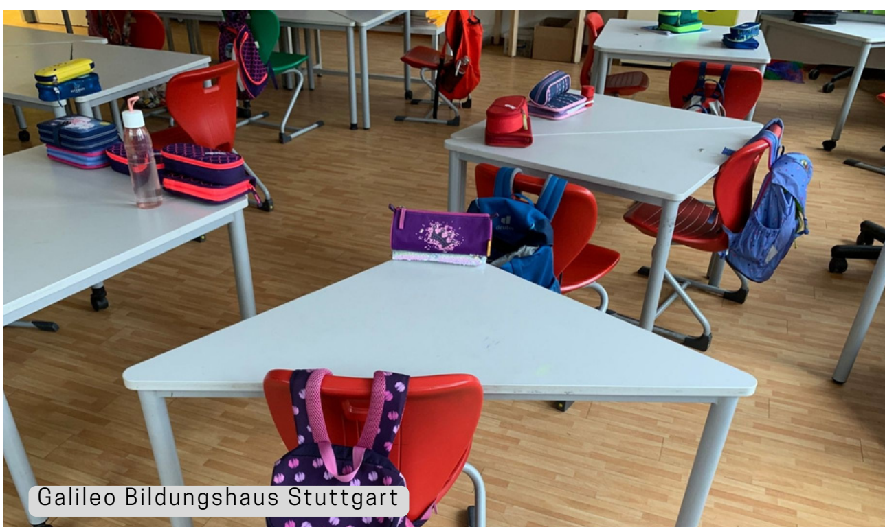
Galileo Bildungshaus Stuttgart