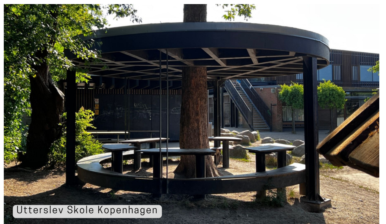
Utterslev Skole Kopenhagen