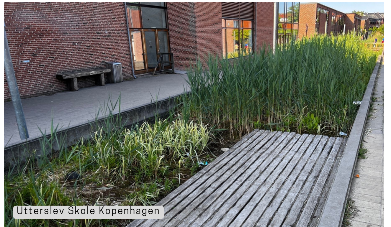
Utterslev Skole Kopenhagen