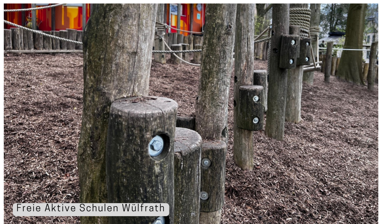
Freie Aktive Schulen Wülfrath