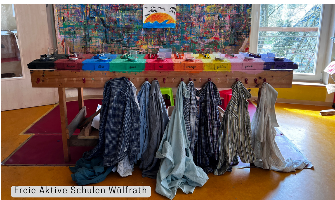
Freie Aktive Schulen Wülfrath