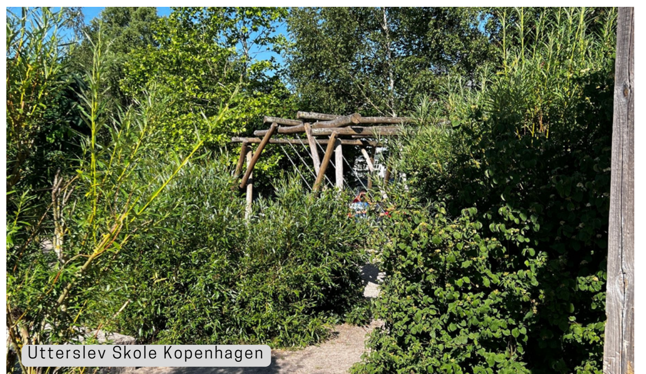
Utterslev Skole Kopenhagen