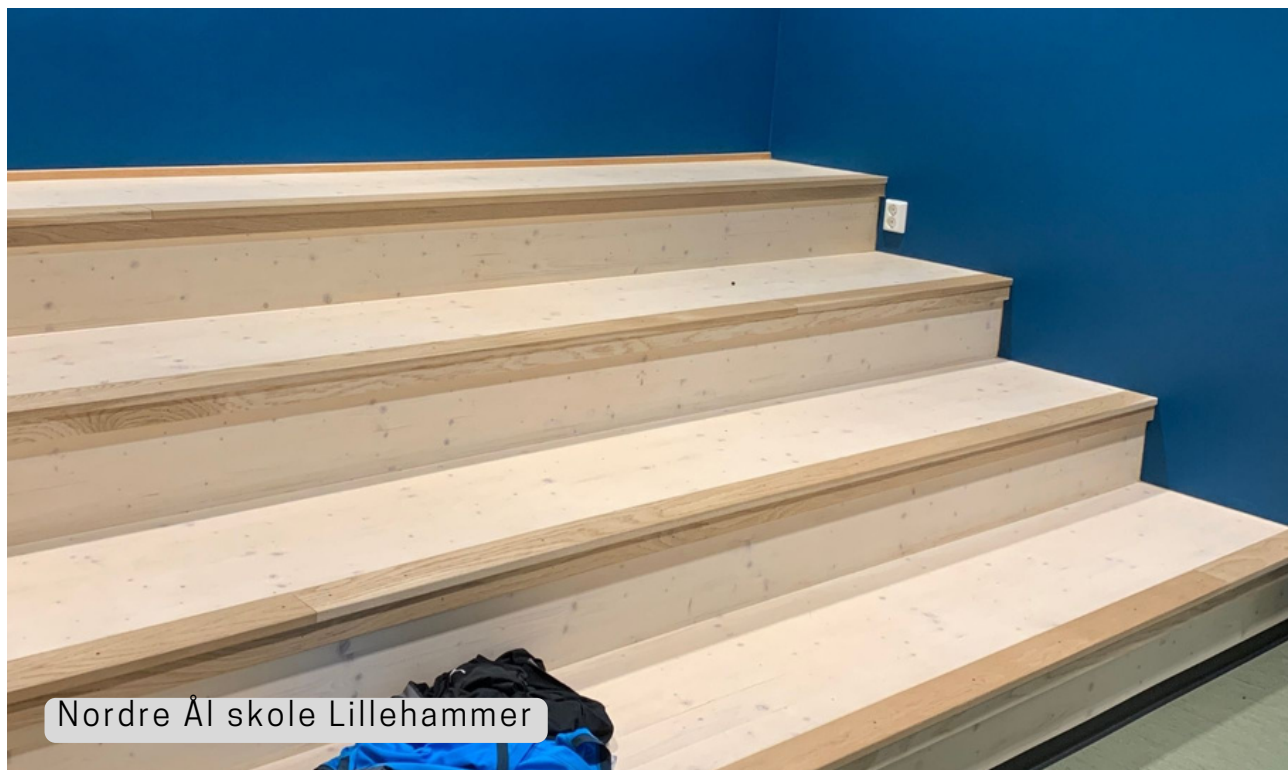
Nordre Al skole Lillehammer

KLASSISCHE EINWEG-KOMMUNIKATION FÜR REFERATE, INPUTS