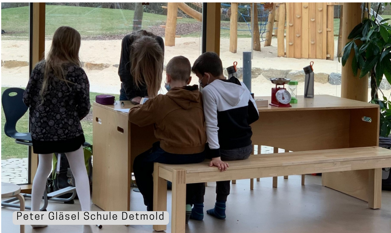
Peter Gläsel Schule Detmold

DIALOGFÖRDERNDE RÄUME, DER GRUPPENGROSSE ANPASSBAR