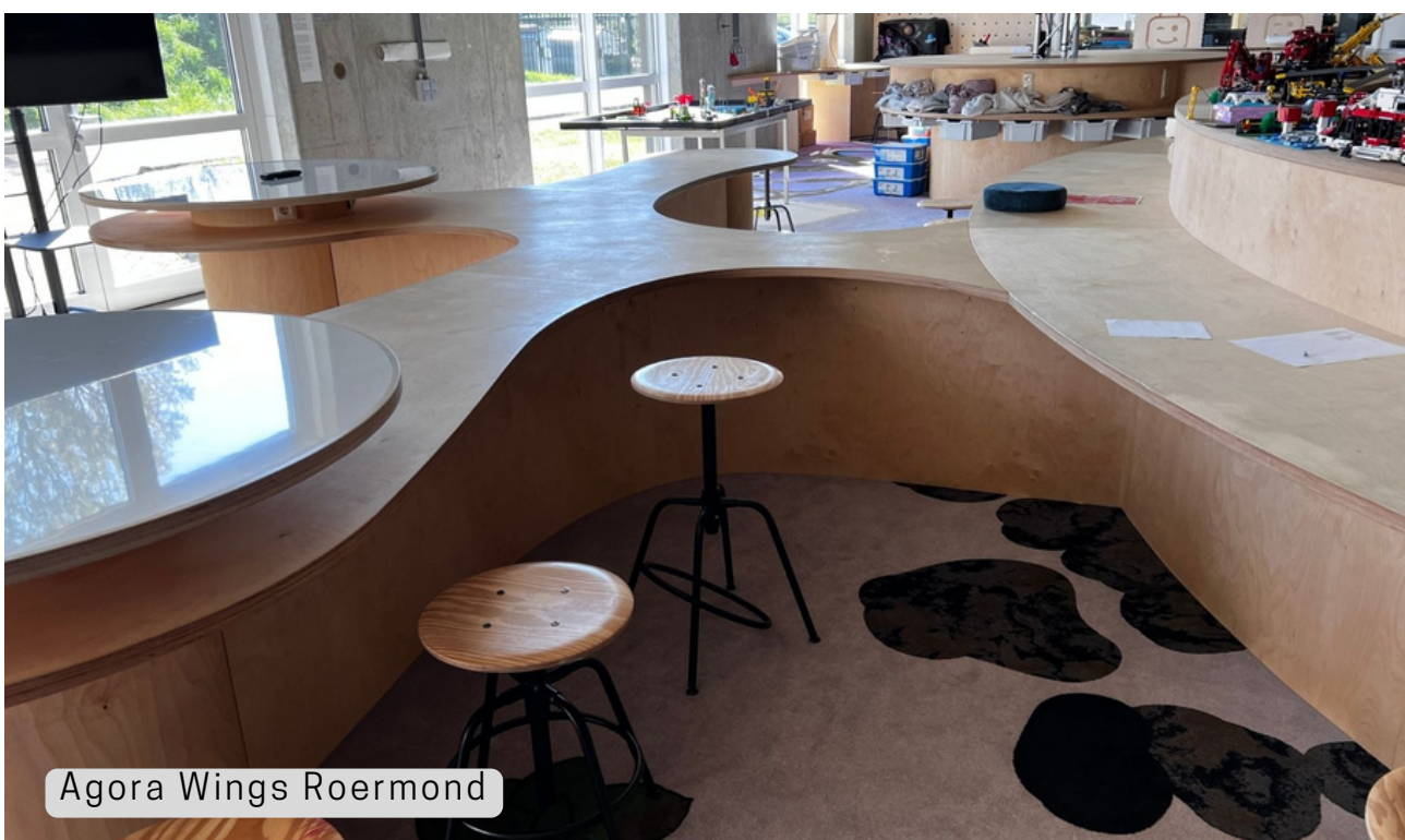
Agora Wings Roermond