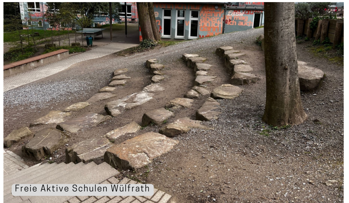
Freie Aktive Schulen Wülfrath