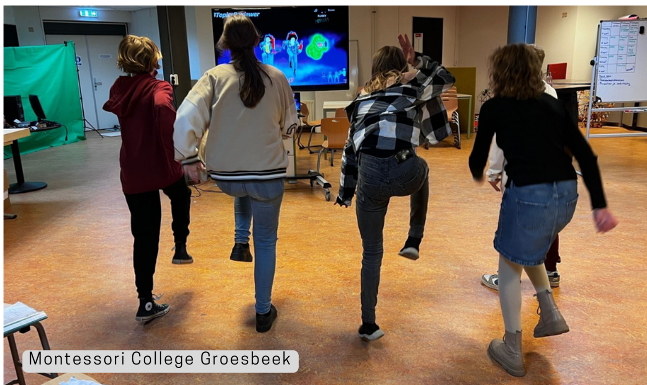
Montessori College Groesbeek