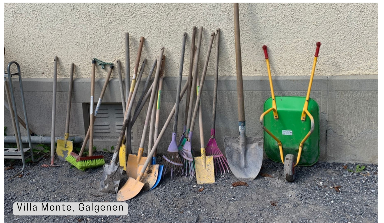
Villa Monte, Galgenen