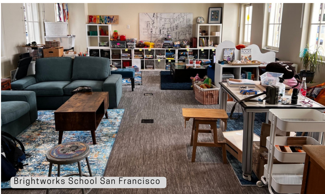
Brightworks School San Francisco