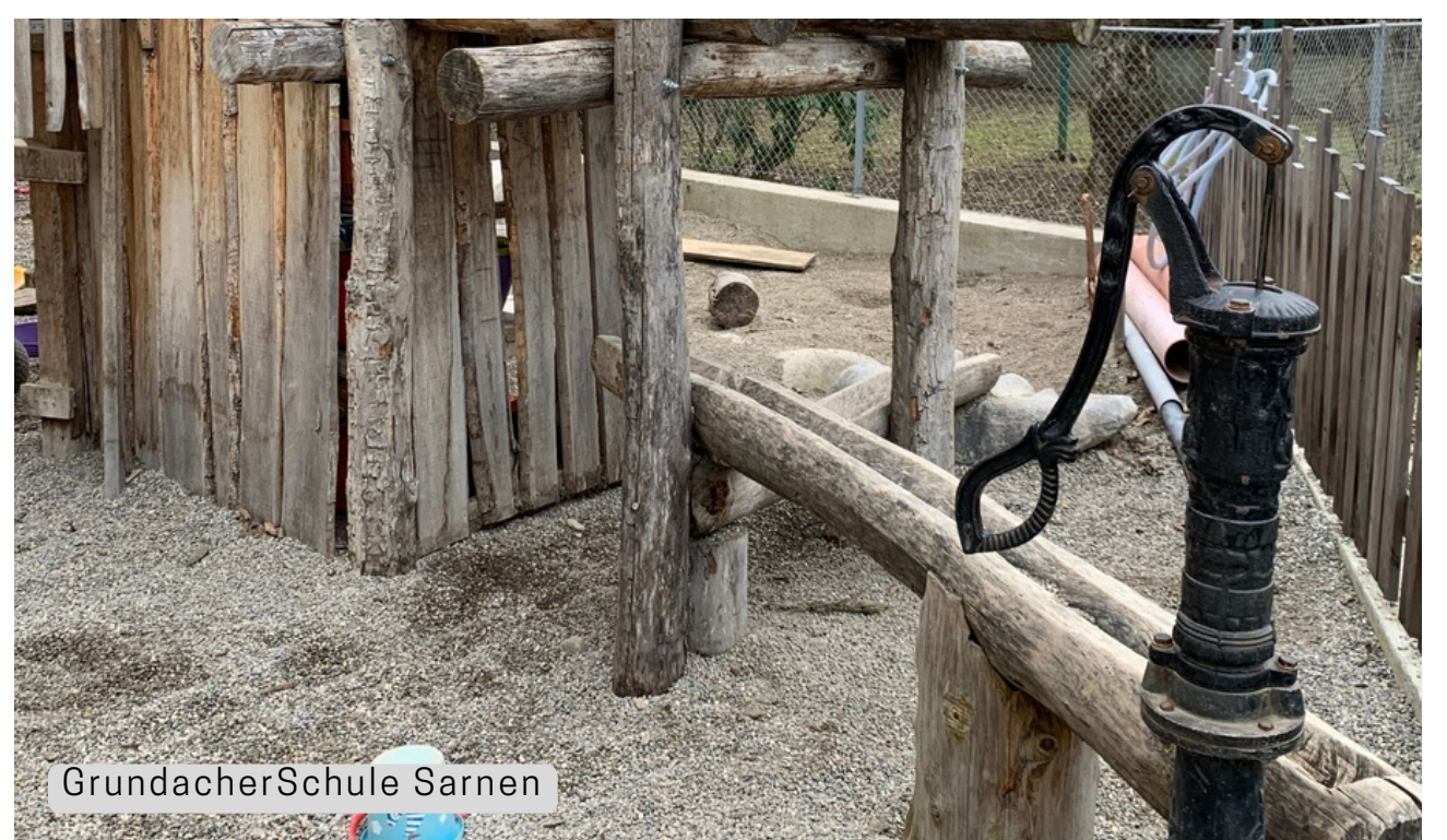
Grundacher Schule Sarnen