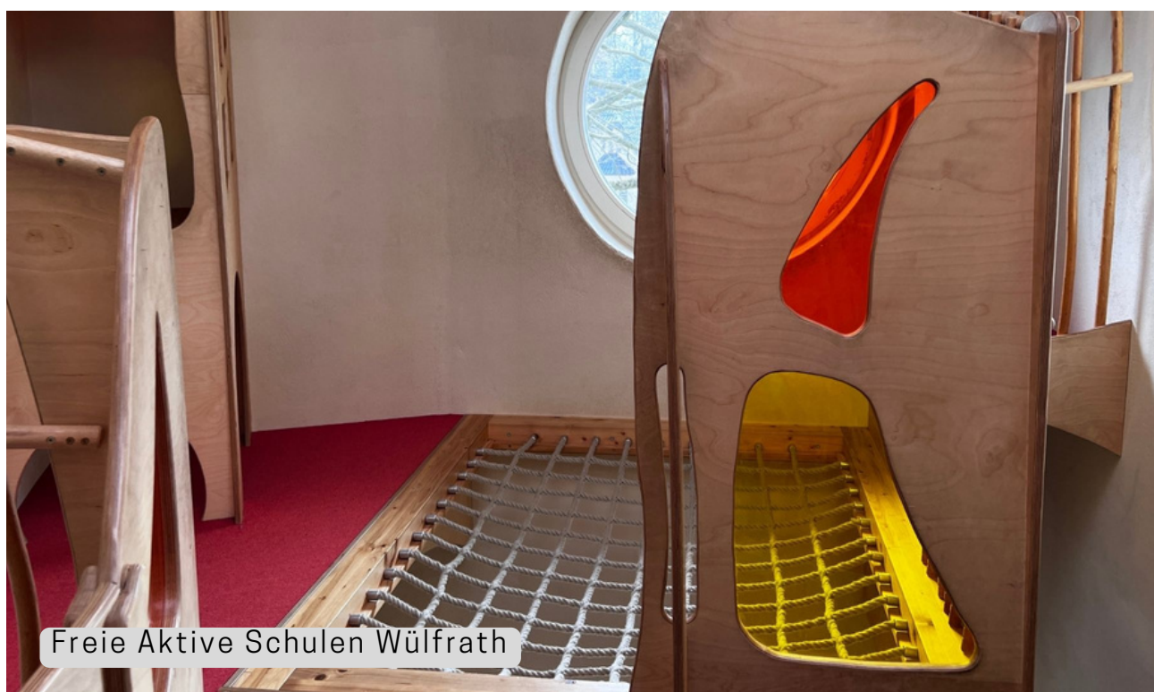
Freie Aktive Schulen Wülfrath