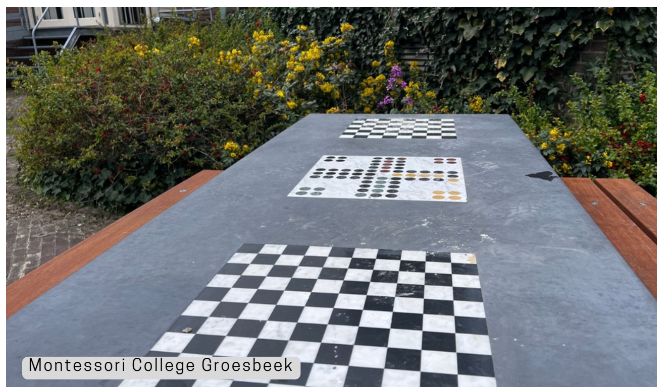
Montessori College Groesbeek